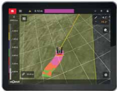
SNOWsat LiDAR OFF

Mit SNOWsat LiDAR können Sie wortwörtlich die Zukunft sehen. SNOWsat LiDAR misst die Schneetiefe bis zu 50 Meter vor und neben dem Fahrzeug. Von der vorausschauenden Schneetiefenmessung profitieren alle Beteiligten: Neben den Fahrern, Beschneiern und Pistenchefs auch die Umwelt und Ihr Geldbeutel. Allen voran aber: Ihre Gäste, die sich Tag für Tag über optimale Pisten freuen können.